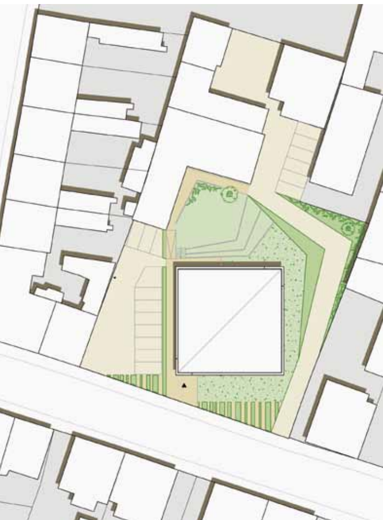
Lage der neuen Kapelle auf dem Grundstück des Piusheims

Der Entwurf für unsere neue St.-Franziskus-Kapelle stammt vom Architekturbüro Kerstin Bochmann aus Chemnitz. Dieser Kirchenbau wird 150 Sitzplätze haben und außer dem Gottesdienstraum noch über eine Sakristei, einen Kindergottesdienstraum und Toiletten verfügen.