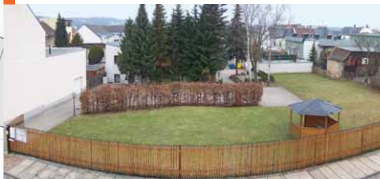
Zukünftiger Bauplatz für die neue St.-Franziskus-Kapelle