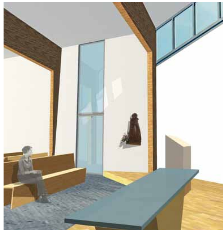
Entwurf des Innenraumes unserer neuen Kapelle

Der Kostenrahmen für den Kapellenneubau beträgt ca. 500.000,- Euro zzgl. ca. 100.000,- Euro für die Innenausstattung. Etwa 30 % der Kirchbaumittel kommen aus dem Haushalt des Bistums Dresden-Meißen und vom „Bonifatiuswerk der deutschen Katholiken“. Knapp 70 % muss unsere Pfarrgemeinde selbst aufbringen.