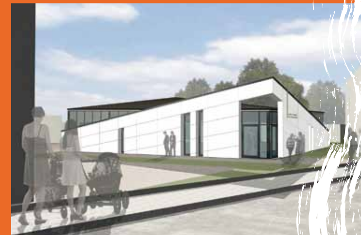
Außenansichten der neuen St.-Franziskus-Kapelle